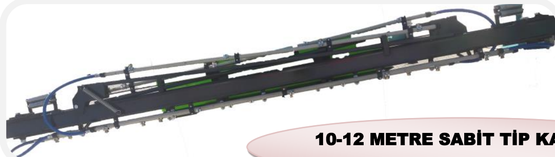
10-12 METRE SABİT TİP KANAT