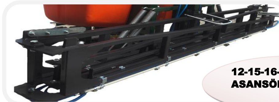
12-15-16-18 METRE ASANSÖR TİP KANAT